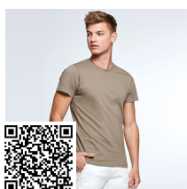
DOGO PREMIUM CA6502