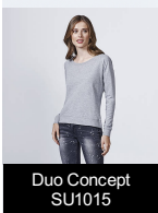
Duo Concept SU1015